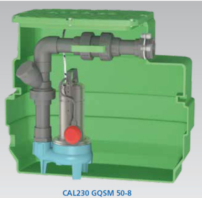
CAL230 GQSM 50-8